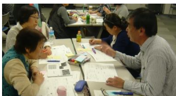
連携案を猛アピール中!