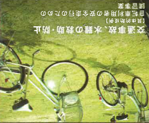
【具体的助成例】 交通事故、水難の救助・防止 自転車利用者の安全走行のための 講習事業