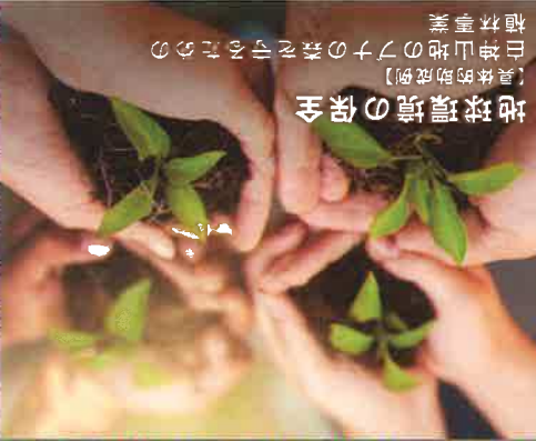
【具体的助成例】 地球環境の保全 巨神山のフナノ森を守るための 植林事業