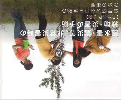
【具体的助成例】 風水害・震災等非常災害時の 救助・災害の予防 河津防災林学生活動の ための事業