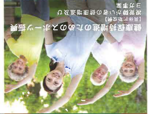
【具体的助成例】 健康保持増進のための入ホーツ振興 視覚障がい者の健康増進及び ヨカ事業