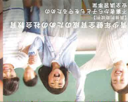
【具体的助成例】 青少年健全育成のための社会教育 不審者から子どもを守るための 安全講習事業