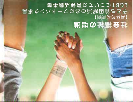
【具体的助成例】 子ども貧困解消のためのフードバンク事業 LGBTについての啓発活動事業