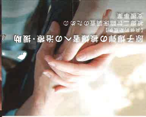
【具体的助成例】 原子爆弾の被爆者への治療・援助 被爆二世臨床調査のための 支援事業