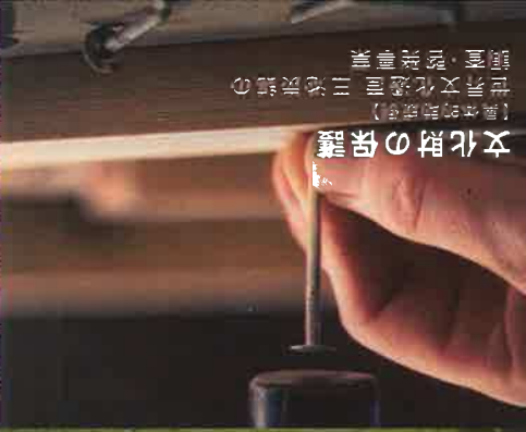
【具体的助成例】 文化財の保護 【具体的助成例】 世界文化遺産 三池炭鉱の 調査・記録事業

2019年度の配分団体名と 使途内容、配分金額の詳細は、 こちらをご覧ください。 https://www.post.japanpost.jp/kitu/