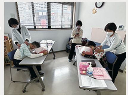
キッズルームが癒しの マッサージルームに大変身！ 「湘南リンパ四季の会」