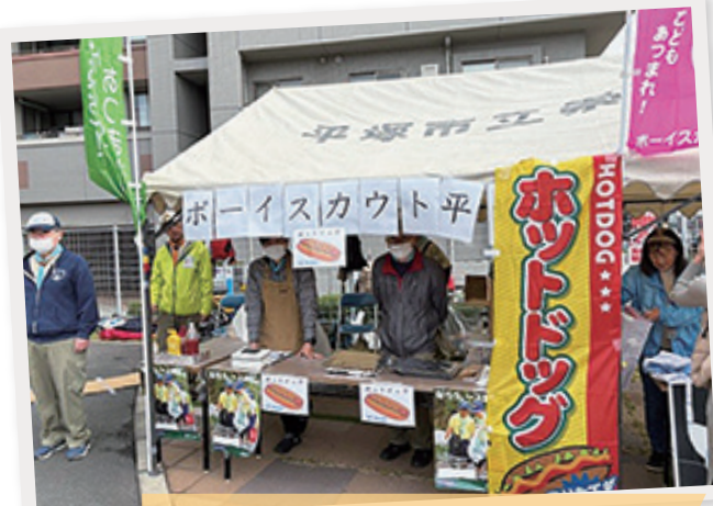
お腹が空いたらホットドックはいかが? 「ボーイスカウト平塚市連絡協議会」