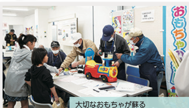
大切なおもちゃが蘇る 「おもちゃの病院ドクターくるりん」