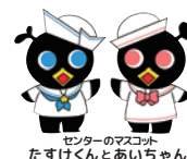
センターのマスコット たすけちゃんとあいちゃん