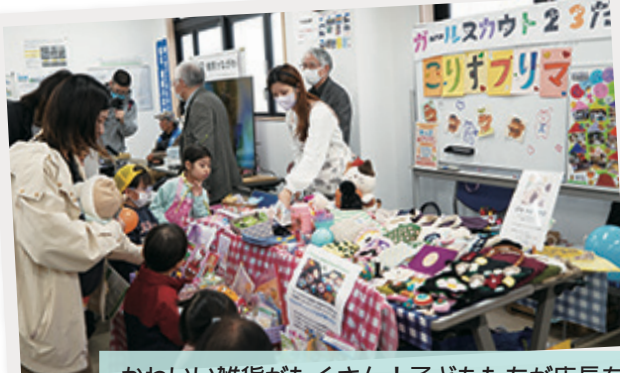
かわいい雑貨がたくさん！子どもたちが店長を務める 「ガールスカウト神奈川第23団」のフリーマーケット