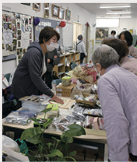
「平塚花のまちづくりの会」は 今年もお花のグッズがたくさん！ バラの育成相談もできます