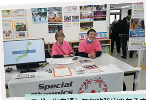
スポーツを通して知的障害のある方の 社会参加を支援します！ 初出展の 「スペシャルオリンピックス(SO) 平塚ボランティアの会」