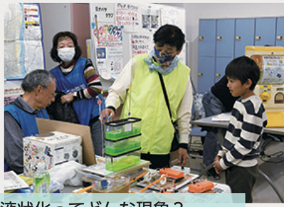
液化化ってどんな現象？ 手作りの実験セットで学べる 「ひらつか防災まちづくりの会」