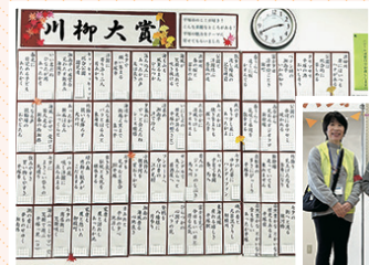
▲平塚の魅力は？ どんなところが好き？ 力作が並びました。