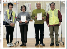
▲川柳大賞表彰式の様子