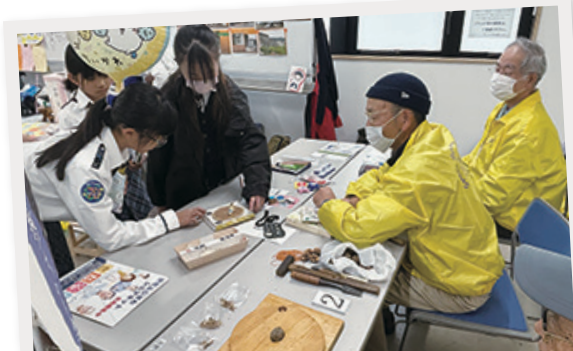
「湘南ふじさわシニアネット」の手作り紙相撲で対戦！

2階会議室A・Bはワークショップ、会議室Cには健康に関するブースが多数展開。 14団体が出展しました。