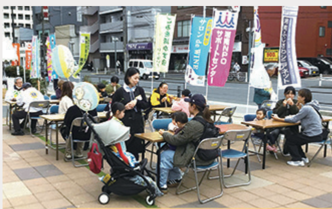
休憩スペースもたくさんご利用いただきました