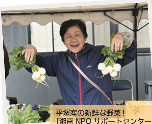
平塚産の新鮮な野菜! 「湘南NPOサポートセンター」 「平塚ライオンズクラブ」の農福マルシェ