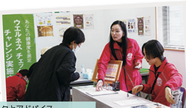
健康チェックとアドバイス 初出展「ひらつかウエルネスクラブ」