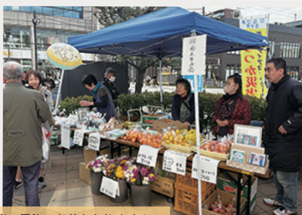
新米・果物・お花もあります♪ 初出展の「湘南あゆみ会」