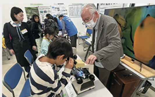
蝶の羽を顕微鏡で見ると…？ 「NPO 教育かながわフォーラム」の体験ブース