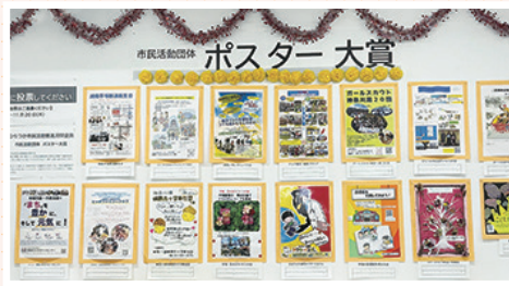
▲活動の魅力を伝えるポスターが並びました