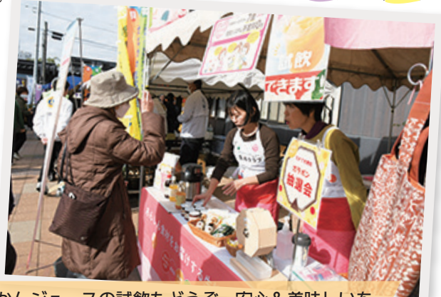
みかんジュースの試飲もどうぞ。安心&美味しいを 届ける「湘南生活クラブ生協(コモンズひらつか)」