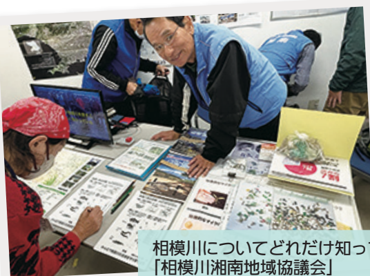
相模川についてどれだけ知ってる？ 「相模川湘南地域協議会」