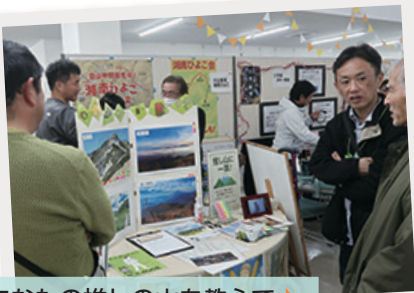
あなたの推しの山を教えて♪ 初出展「山岳会湘南ひよこ」