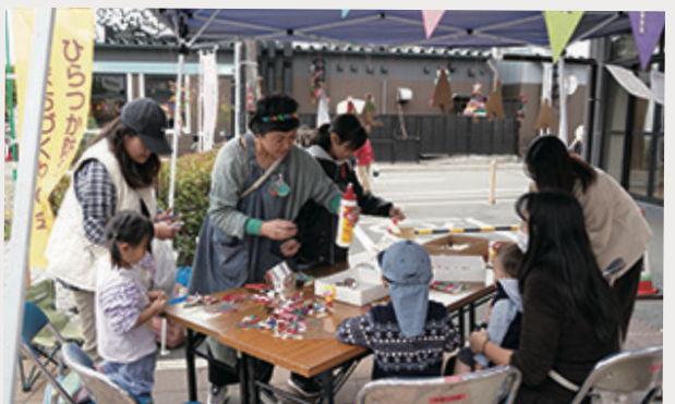
初出展! 「あそびのスタジオ pepika」は子どもたちが リボンのクリスマスツリーを作っていました