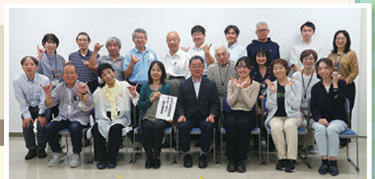
▲実行委員の皆さん、 半年間ありがとうございました！