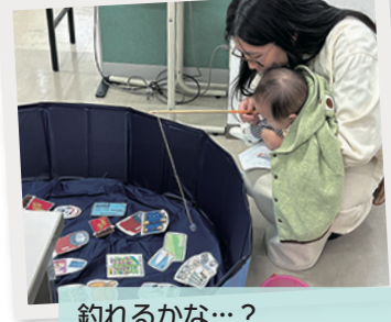
釣れるかな…？ 「ひらつか災害ボランティアネットワーク」の防災釣り