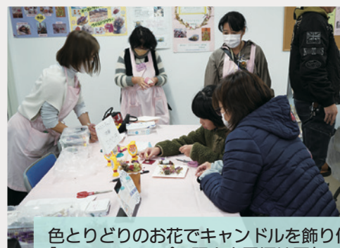
色とりどりのお花でキャンドルを飾り付け♪ 「フラワーセラピー研究会平塚地区」