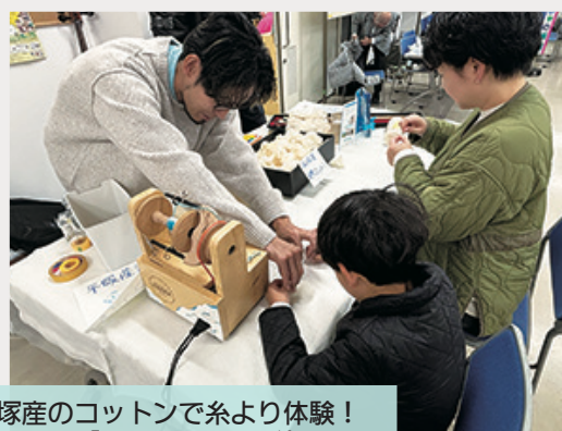
平塚産のコットンで糸より体験！ 初出展の「ニュードクラブ」