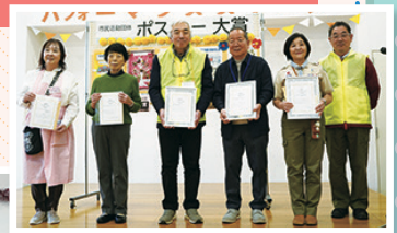
▲ポスター大賞授賞式の様子。 今年は5団体が表彰されました